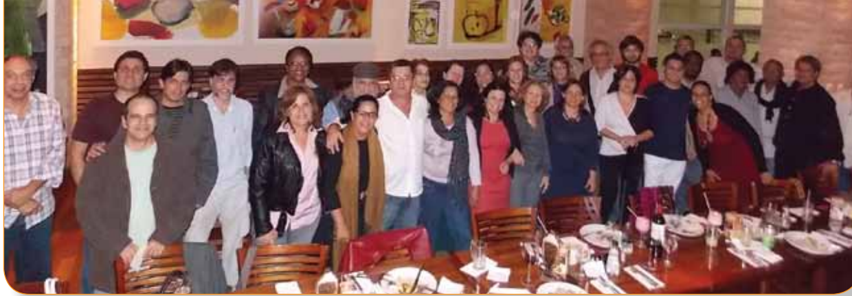
Jantar de confraternização entre diretores e ex-diretores do Sindicato