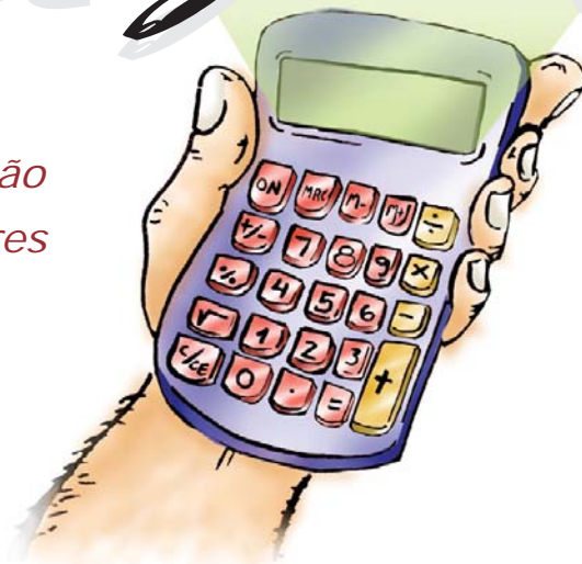
Ilustração: Cassiano Pinheiro

Emendas ao Plano Próprio são encaminhadas e trabalhadores calculam efeitos em seus contracheques